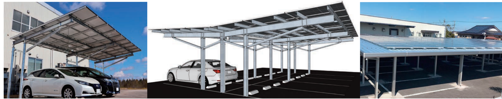
主なラインナップ内容