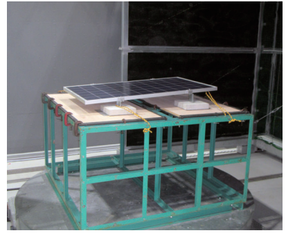
動風圧試験により性能を計測