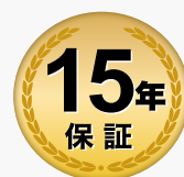
XSOL蓄電池プレミアム保証